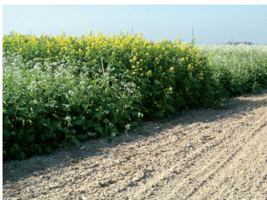
Fig.2 - Prove di piante da sovescio