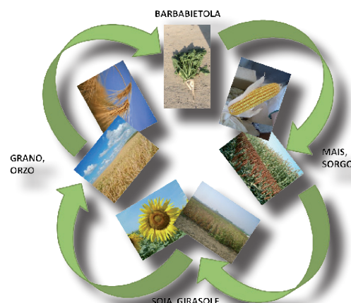
Tab.1 - Alcune colture ospiti dei nematodi da evitare in precessione alla barbabietola