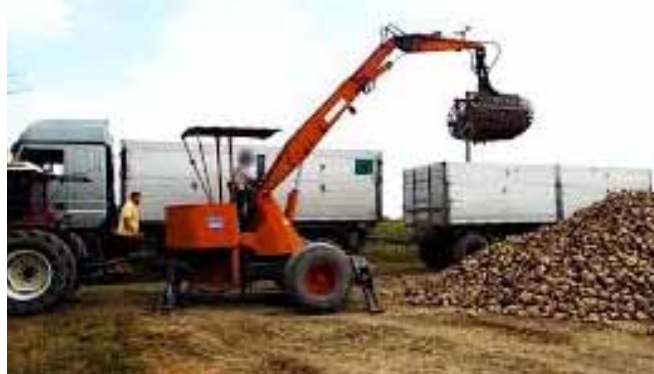
Foto 1. Packer per la raccolta del cumulo

Si raccomanda di provvedere alla consegna a COPROB di tutta la documentazione indicata nell'Allegato 1 del Disciplinare di Produzione per poter procedere con il ritiro delle barbabietole.