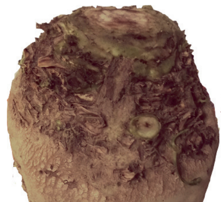
Figura 1. esempio di scollettatura corretta in campo

• qualità esterna : riferita alla scollettatura e alla presenza di ferite nei fittoni nonché all'insieme delle impurità che vengono consegnate alla fabbrica (tara).