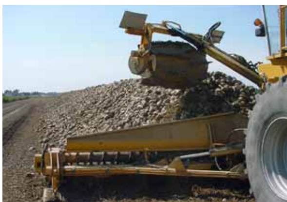
Foto 1. Caricatore-sterratore in azione: il cumulo dovrà essere dimensionato in base alla sua dimensione operativa